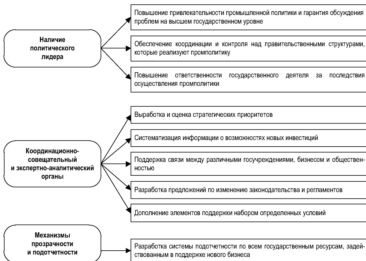
Рисунок 2. Формирование общественных институтов проведения промышленной политики [11]

изменений, корректировку рыночных сил за счет усиления или снижения эффекта распределения ресурсов, содействие в достижении синергетического эффекта, максимального увеличения собственного потенциала экономического роста, снижения рисков производственных потерь и погони за рентой. Такая промышленная политика может быть действенным инструментом